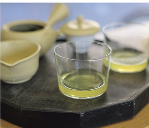
■旨みの豊富な「山のお茶」にこだわり、最も適した加工をして製品に仕上げる

「茶を通して、ポジティブな明るいニュースを提供できるような事業者を目指します」と未来を見据える姿を見せてくれた。