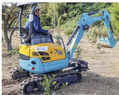
▲ 寄贈したバックホーと整備した園地