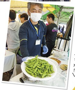
「どーんと大盛エガマメ！」