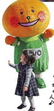
大人気のかんたんくとみーちゃん♪