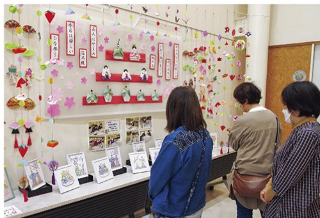
昨年のひな飾りの展示