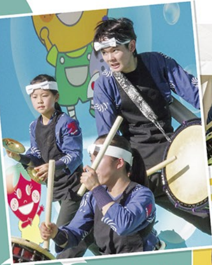
信濃国松川響岳太鼓子供会による 圧巻の太鼓演奏!