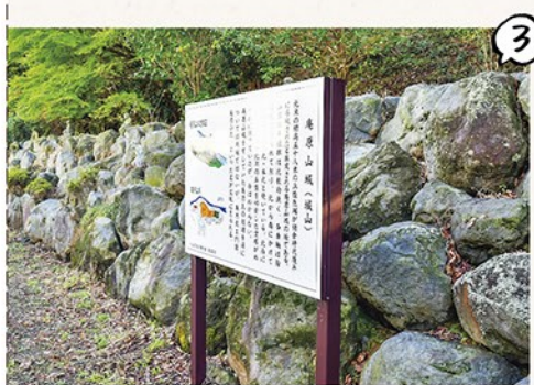
③ 庵原山城址の案内板 / この付近にあった庵原山城について記載されています。後ろの石垣上にはさまざまな表情の羅漢さまが一定間隔でいらっしゃいました。