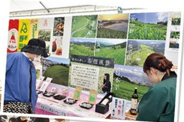
展示ブースも盛況