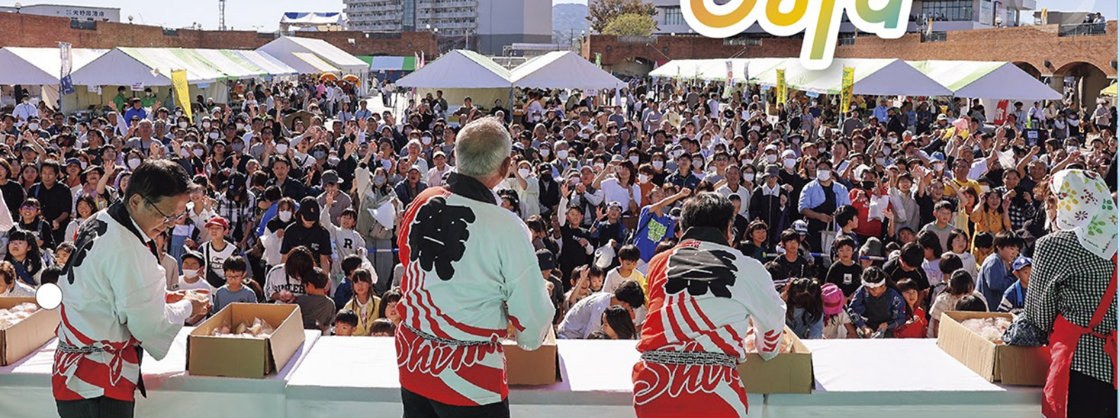
「いらっしゃいませ♪」