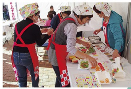
女性部は野菜スタンプで小物作り体験