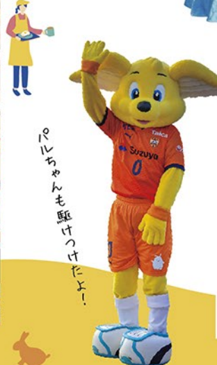
「ルちゃんも駆けつけたよ！」