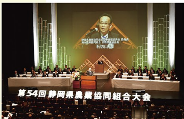
12月7日に開かれた県農協大会にはJAの組合員や役員800人が参加。次期3か年計画を決議した。

静岡県JAグループは12月7日、第54回静岡県農業協同組合大会を静岡市内で開催し、2025年度から3年間の静岡県JAグループの方針となる「JA静岡3か年計画～農業と地域の未来をつむぐ、協同の力、～」の樹立・実践を決議しました。