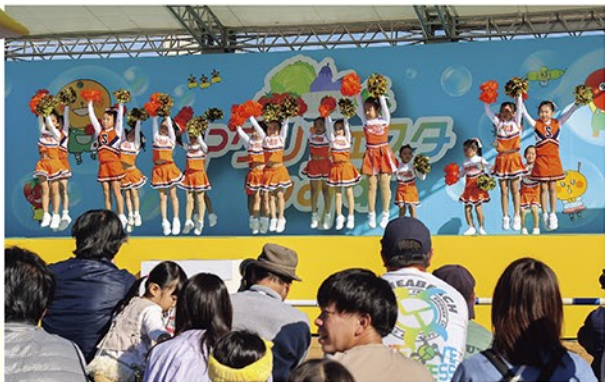
エスパルスダンススクールの子どもたち