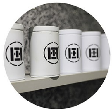
■屋号の入ったお茶缶でアピール

時間もかからない。でも手でやっていくことにこだわりたい」と道具を見つめて話す。「人間の手から生み出される茶に価値を感じる。ロマンですかね」と笑みを浮かべる。それらの言葉は、先々代から続く手作業工程の意味と文化的価値を未来へ残す使命を感じさせてくれた。