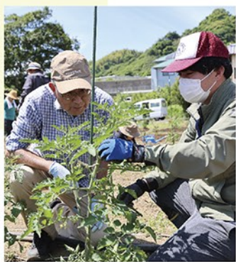
JALみずでは直売所出荷者を増やそうと「園芸塾」を開き、野菜の栽培指導を行っている

このようななかで、JAが将来にわたって地域から必要とされるためには、事業環境の変化に的確に対応しながら、