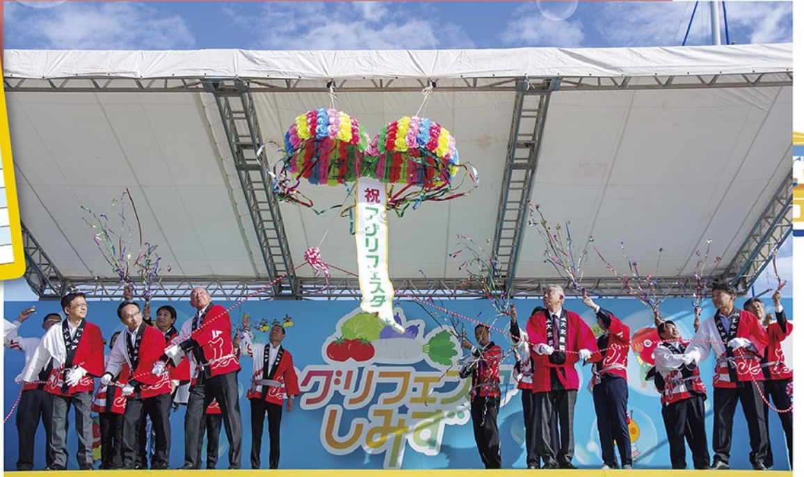
オープニングセレモニー