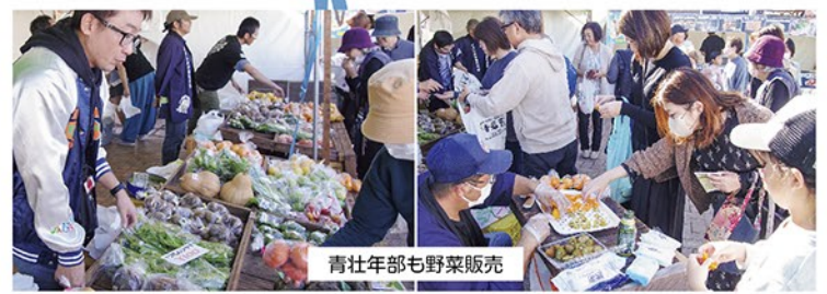
青壮年部も野菜販売

市民楽団「清水イルコンパニー」 長泉たけはら楽団と 清水第三・五・六中の 吹奏楽部が共演