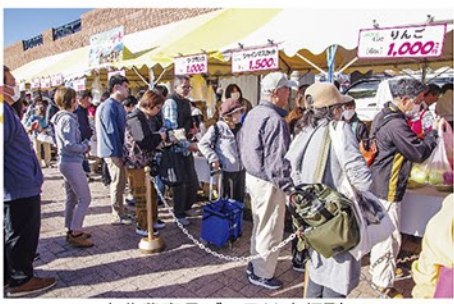
大北農産品ブースは大行列