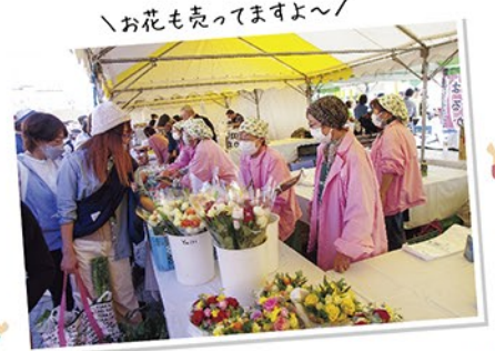
「お花も売ってますよ〜」