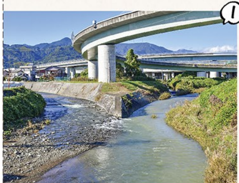
① 庵原川と山切川の合流点 / 昭代橋からの眺めです。やはり瀬音は心が和みますね。

に県道7号線(清水富士宮線)を南に歩きます。時間(平日昼間)にしては車の往来が多いので、新田橋を左に曲がり清水庵原中学校方面に歩みを進めます。途中、お地藏さまが大勢いらっしやるお堂に手をあわせつつ、庵原郵便局、原自治会館を通り過ぎ、原橋を渡り再び県道7号線に合流、そのまま庵原支店に到着です。距離にして約7km、時間にして2時間程の行程でしたが、いつも以上に気ままに歩くことができちゃったです。