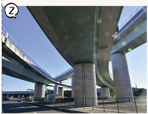
② 新東名(清水ジャンクション付近) / 下から見るとその巨大さに圧倒されます。人間の建造技術というのはすごいものです。