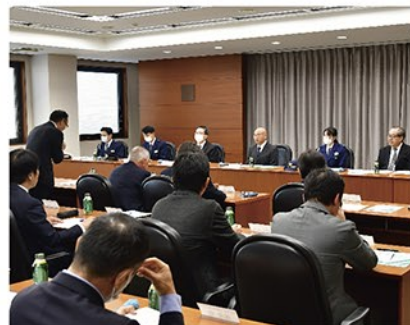
▲ 地域の防犯と安全対策を共有した協議会